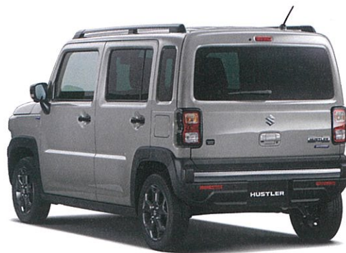
Photo: タフワイルド 2WD 全方位モニター付メモリーナビゲーション・スズキコネクト対応通信機装着車 ボディカラーは(左) オフブルーメタリック ブラック2トーン(DZ8) / (右) スチールシルバーメタリック(ZVC)