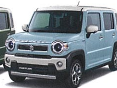
オフブルーメタリック ソフトベージュ2トーン (ER5)