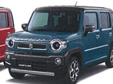
デニムブルーメタリック ガンメタリック2トーン (D4E)