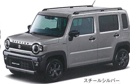
スチールシルバー メタリック (ZVC)