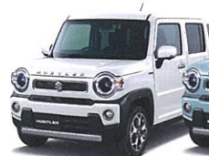
ピュアホワイトパール (ZVR)