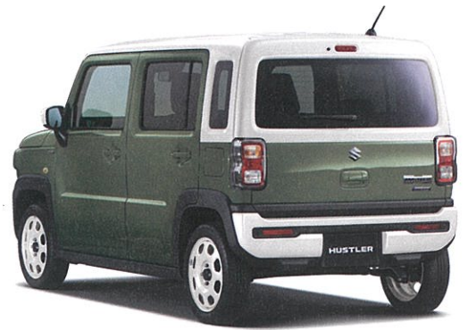
Photo: HYBRID G 2WD車 ボディーカラーは(左)ソフトベージュメタリック(WBB) / (右)クールカーキパールメタリック ソフトベージュ2トーン(ER6)