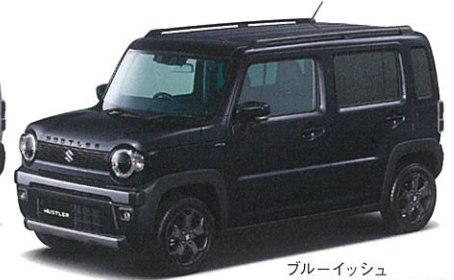
ブルーイッシュ ブラックパール3 (ZJ3)