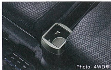
■ファブリックシート表皮[撥水加工][カーキステッチ] ■インパネカラーガーニッシュ[マットカーキ] ■ドアトリムクロス[撥水加工](フロントドア) ■ドアトリムカラーガーニッシュ[マットカーキ] ■フロアコンソールトレイ[ドリンクホルダー付][マットカーキ]