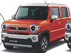
NEW パーミリアンオレンジ ソフトベージュ2トーン (E7T)