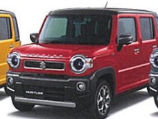
フェニクスレッドパール ガンメタリック2トーン (DW6)