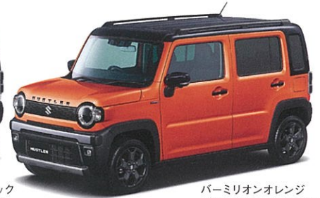
パーミリアンオレンジ ブラック2トーン (E73)