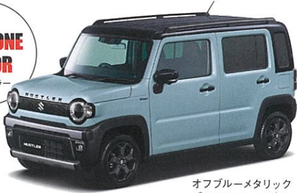
オフブルーメタリック ブラック2トーン (DZ8)