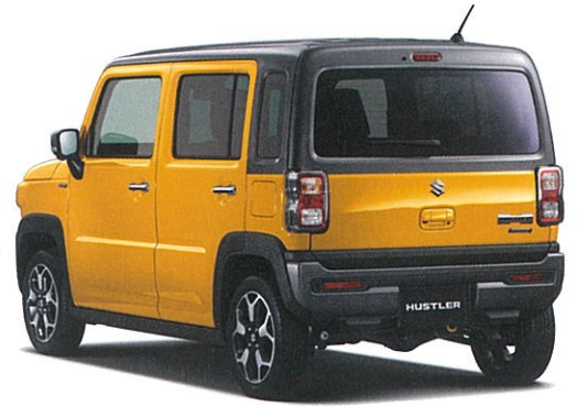
Photo: HYBRID X 4WD 全方位モニター付メモリーナビゲーション・スズキコネクテ対応通信機装着車 ボディカラーは(左) パーミリオンオレンジ ソフトベージュ2トーン(E7T)/(右) アクティブイエロー ガンメタリック2トーン(DW2)