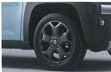
■カラードアハンドル[ブラック] ■メッキバンパーガーニッシュ(リヤ) ■リヤコンビネーションランプ[ブラック塗装] ■タフワイルドエンブレム(バックドア) ■15インチアルミホイール[ブラックメタリック]