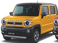
NEW アクティブアエロ ガンメタリック2トーン (DW2)