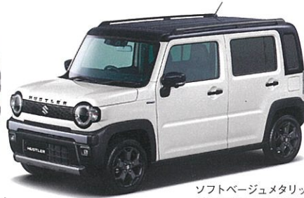
ソフトベージュメタリック ブラック2トーン (E7Z)