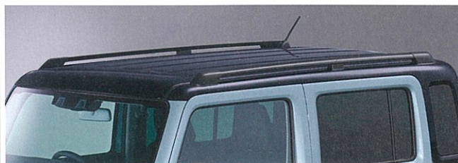
■フロントグリル[ブラック] ■メッキバンパーガーニッシュ(フロント) ■ヘッドランプガーニッシュ[ブラック] ■ルーフレール ■HUSTLER アルファベットエンブレム[ブラックメッキ](フロントフード) ■カラードアミラー[ブラック]