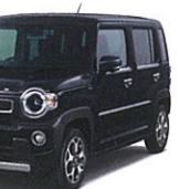
ブルーイッシュ ブラックパール3 (ZJ3)