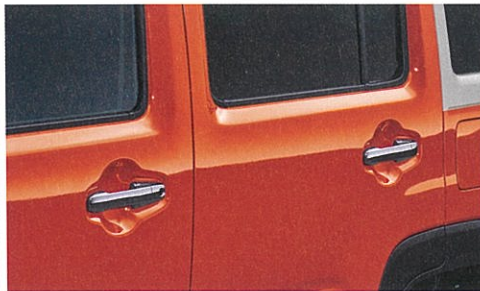
■メッキドアハンドル