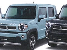
オフブルーメタリック (ZYW)