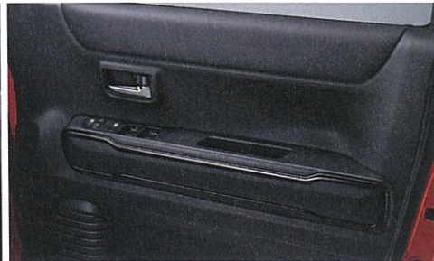
■ドアトリムクロス[レザー調] (フロントドア) ■メッキインサイドドアハンドル ■ドアトリムカラーガーニッシュ[ブラックパール]