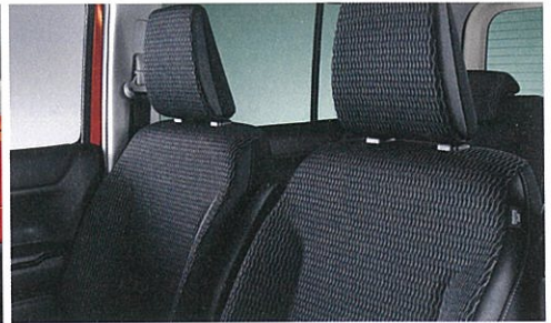
■レザー調&ファブリックシート表皮[ダークグレー]