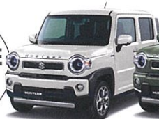
NEW ソフトベージュメタリック (WBB)