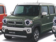
クールカーキパールメタリック ソフトベージュ2トーン (ER6)