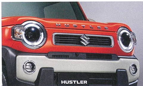
■メッキフォグランプガーニッシュ ■HUSTLERアルファベットエンブレム[メッキ] (フロントフード)