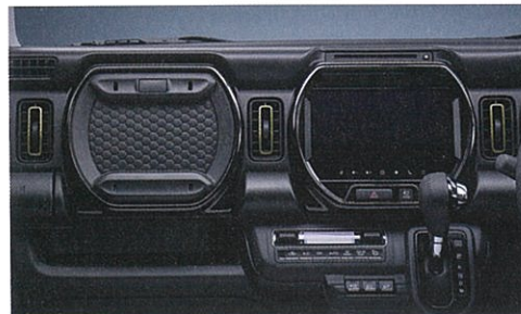
■インパネカラーガーニッシュ[ブラックパール] ■エアコンルーバーアクセント[ゴールド調]