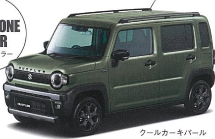
クールカーキパール メタリック (ZVD)