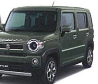
クールカーキパールメタリック (ZVD)